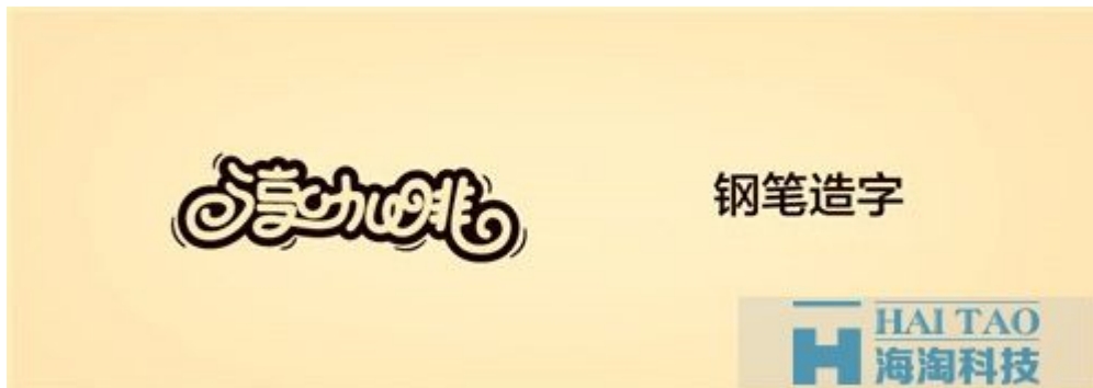
电商网站建设之网页字体设计。